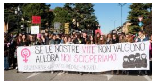
Lo striscione mostrato da un gruppo di studentesse